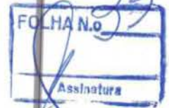
ROGÉRIO CLEBER PERES PREFEITO MUNICIPAL.